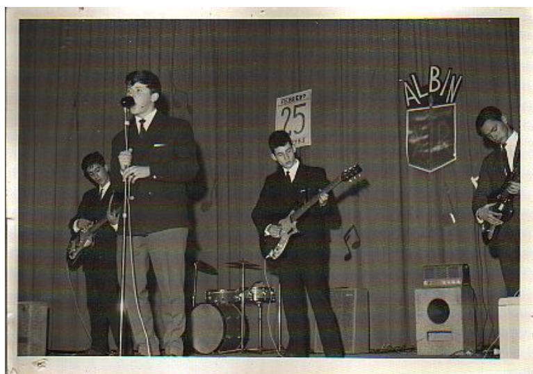
THE DAVYS ROYER'S

El que fuera cantante de los Davys Royer's le estrechó la mano, cumplimentando al socio amanuense del Conde. Como hemos visto, el anfitrión había venido preparado con fotos y apuntes, a los que seguíamos echando un vistazo.