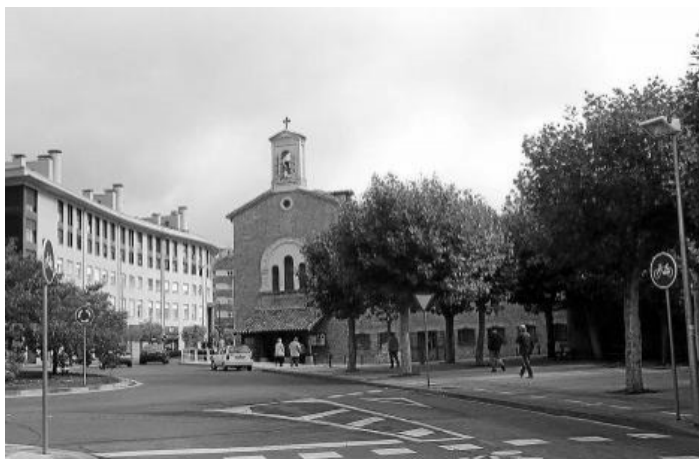
CONVENTO DE LOS PP CAPUCHINOS EN ERROTAZAR

En este salón, cine de los PP Capuchinos de Errotazar, cabrían alrededor de doscientas personas, quizá menos, que fueron desapareciendo entre la niebla que iba rodeando el río, mientras se guardaban los aparatos musicales en el interior de la furgoneta de Osés, y estos artistas se dirigían andando hacia el centro de la villa pompeyana, para dar una vuelta, relajarse un tanto y catar el ambiente, ya claramente navideño, de esta sacrosanta ciudad. Los instrumentos los descargarían al día siguiente, en la bajera de la calle Olite.