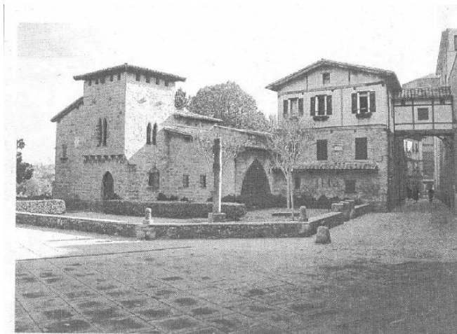
MESÓN DEL CABALLO BLANCO (16)

En este acogedor txoko organizan, todos los otoños, desde el año 2000 hasta hoy, distintas y buenas actuaciones, para todo tipo de público y, en todos los géneros musicales posibles.