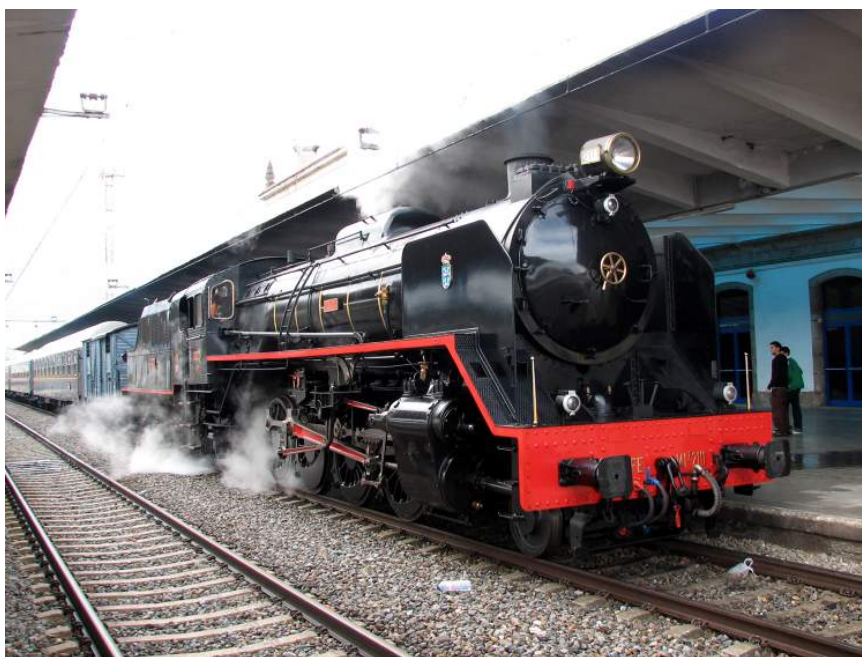
El tren de la Valdorba