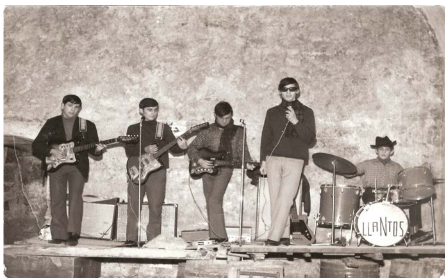
Los Llantos, ensayando en estos sótanos, de la Casa de los Urdín.