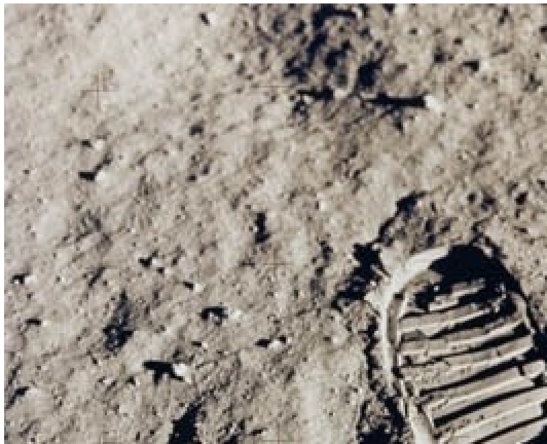
1969. La primera huella del hombre sobre la luna

Eso de dejar huella de un cierto tamaño, es como quedar ligado a la historia para siempre.