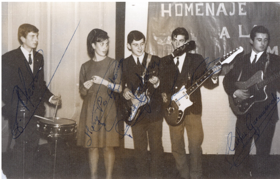
“Dálmatas” en el antes mencionado festival dedicado a “La Madre” locales del caserón donde se ubicaba el “Centro Mariano” y los talleres de edición del periódico “Arriba España”.