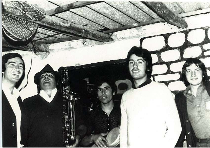
Local de Ensayo Chantrea